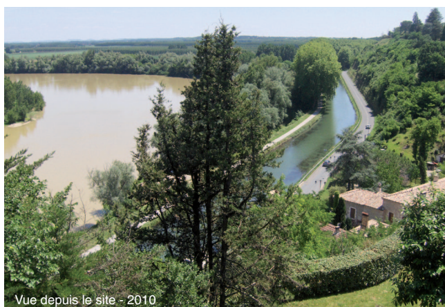
Vue depuis le site - 2010

« Dominant une boucle de la Garonne, le bourg de Meilhan jouit d'une vue exceptionnelle, qui permet certains jours d'apercevoir la ville d'Agen. Cette position privilégiée a attiré depuis de nombreux siècles l'homme et sa famille. Lieu de défense, Meilhan est devenu progressivement un grand bourg rural, résidentiel et commercial. La création du canal latéral à la Garonne a entraîné la mise en place d'un port pour accueillir les péniches en transit, port toujours existant où se côtoient aujourd'hui péniches et bateaux de plaisance ». ...« Au centre du village, la grande place est aussi une sorte de terrasse, où le promeneur peut contempler le paysage alentour ». ...« Le bourg lui-même a peu changé. Les maisons, frileusement serrées les unes contre les autres, sont typiques de l'habitat local {...} » (rapport de présentation – Inspecteur régional des Sites – non daté).