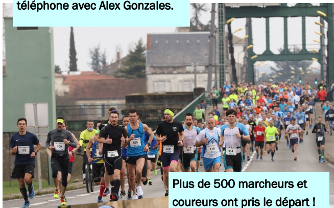
Plus de 500 marcheurs et coureurs ont pris le départ !